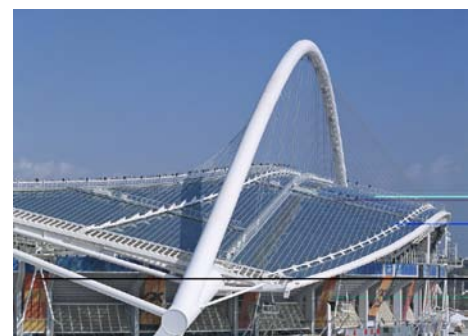
Makrolon multi UV 5M

☎ 032 366 74 00 ☎ 032 366 74 25 ✉ info@notz-plastics.ch